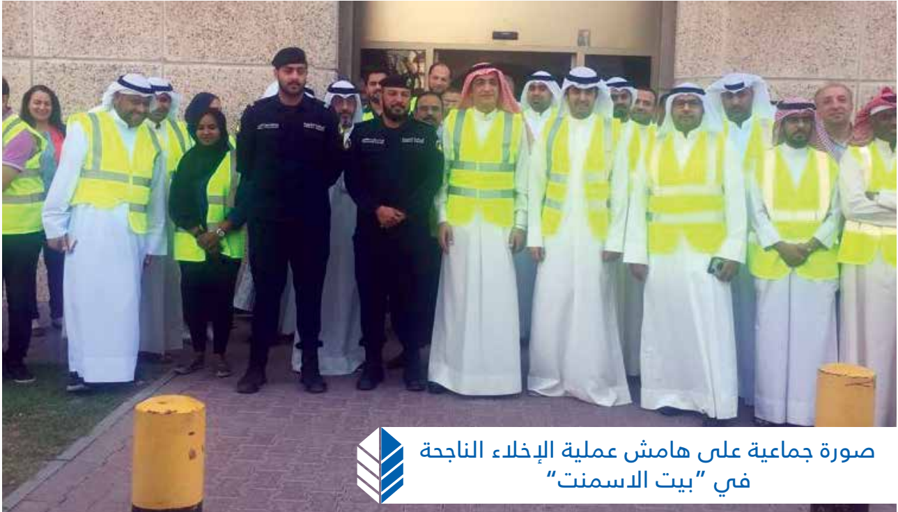
صورة جماعية على هامش عملية الإخلاء الناجحة في «بيت الاسمنت»

إنطلاقاً من حرص شركة أسمنت الكويت وإهتمامها في الإلتزام بالمسؤولية الإجتماعية لديها بإعتبار ذلك إحدى الجوانب الرئيسية في مهمة الشركة وأهدافها ، نفذت الشركة بنهاية شهر أكتوبر 2019 وبالتنسيق مع وزارة الداخلية وحضور المسؤولين في الإدارة العامة للدفاع المدني تجربة عملية إخلاء وهمي ناجحة لجميع العاملين لديها وللمستأجرين في المبنى ، وكانت الإستجابة الفورية من جميع الموجودين في المبنى لمعطيات التجربة والتعامل معها وفق الإشتراطات المطلوبة ، حيث جاءت نتيجة التقييم من قبل الإدارة العامة للدفاع المدني بدرجة «ممتاز» .